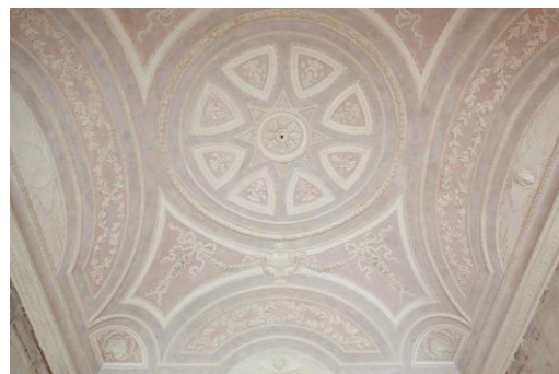
IMMAGINI ANTE INTERVENTO